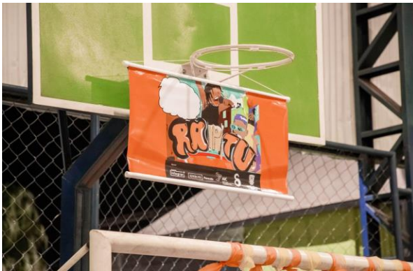
Ocupação da praça