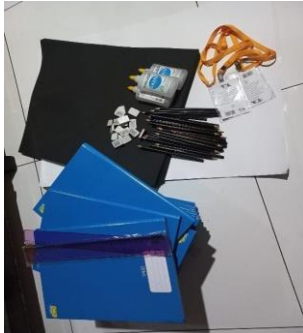
Materiais adquiridos para serem distribuídos para as crianças