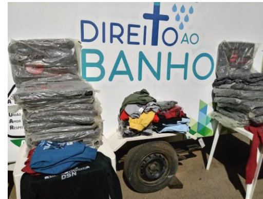
Blusas e cobertores adquiridos