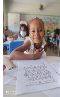
Atividade de escrita