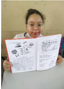
Sequências Didáticas construídas para as aulas