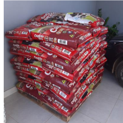
Sacos de ração adquiridos