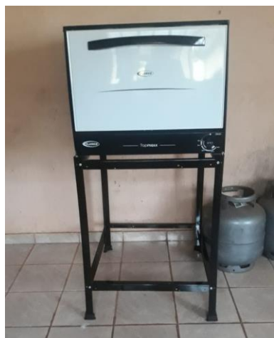
Forno à gás