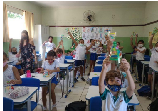
Oficinas de construção de biloque e porta-lápis