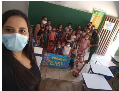
Recepção dos alunos