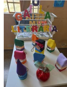
Gaiola Literária – incentivo à leitura