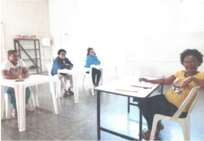
Oficinas com aprendizes