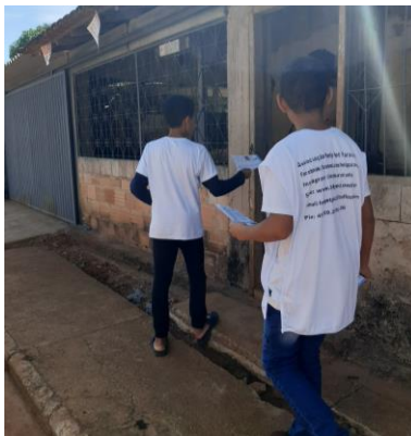
Ação de panfletagem