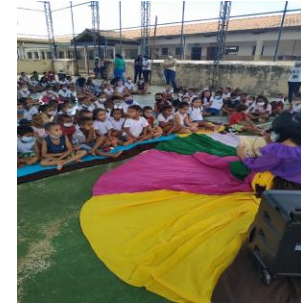
Contação de história para todos os alunos do vespertino