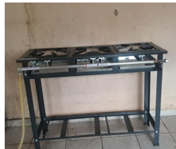
Fogão industrial 3 bocas