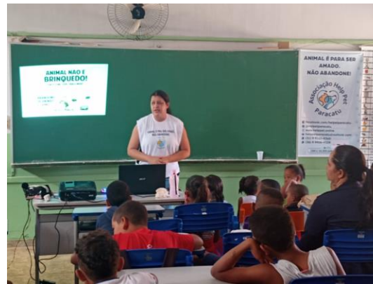
Palestra na escola