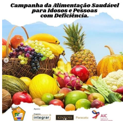
Postagens sobre alimentação adequada para idosos e pessoas com deficiência