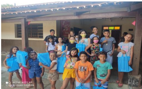
Distribuição dos materiais