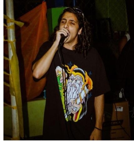
Batalha de rimas