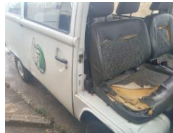
Reparo do Estofado