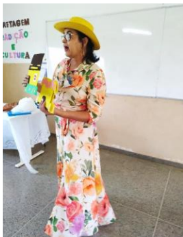
Contação de história para introdução das sequências didáticas