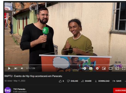
Divulgação na mídia local