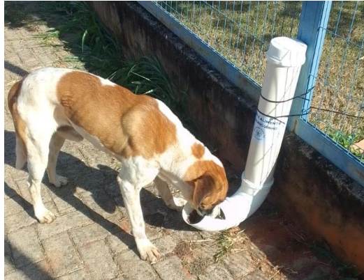
Comedouros e bebedouros instalados