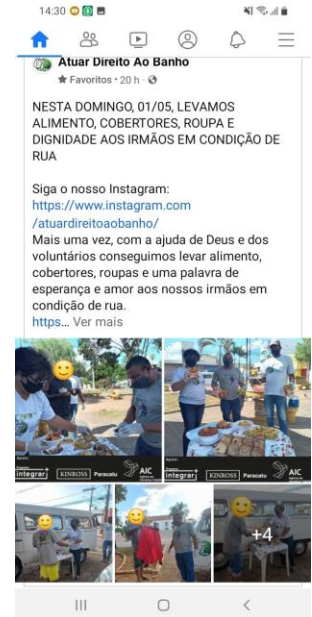
Ações de distribuição de quentinhas e promoção do banho cuidados pessoais