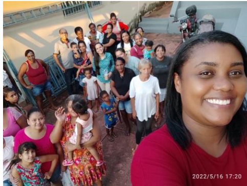
Distribuição de pão e leite para as famílias participantes