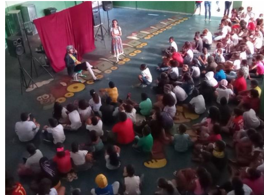
Apresentações nas escolas