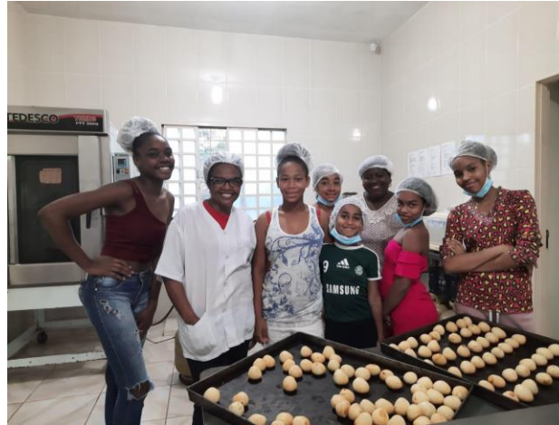
Oficina com adolescentes